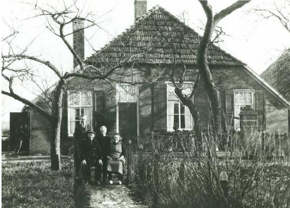
Boerderij de Brinke